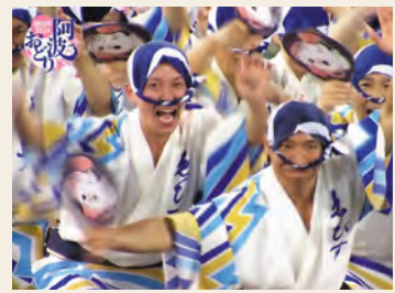
2024徳島市阿波おどりダイジェスト

6月21日(土)に、「渋谷ストリーム ホール」で行われる『2025 THE AWAODORI - 序章-』。徳島市の選抜連が「本物の阿波おどり」を披露します。イベントに合わせ、昨年の『徳島市阿波おどりダイジェスト』の放送他、徳島県の魅力を知れる番組を特集でお届け。