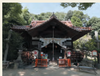
尾道神社物語 御袖天満宮

広島県尾道市内にある神社を取り上げるシリーズ番組『尾道神社物語』を全10話一挙放送します! 各神社の歴史や伝説、そして地域に根付いた信仰の姿を丁寧に紹介します。神社巡りを通じて、尾道の豊かな文化と自然の美しさなど、尾道の新たな一面を感じてください。